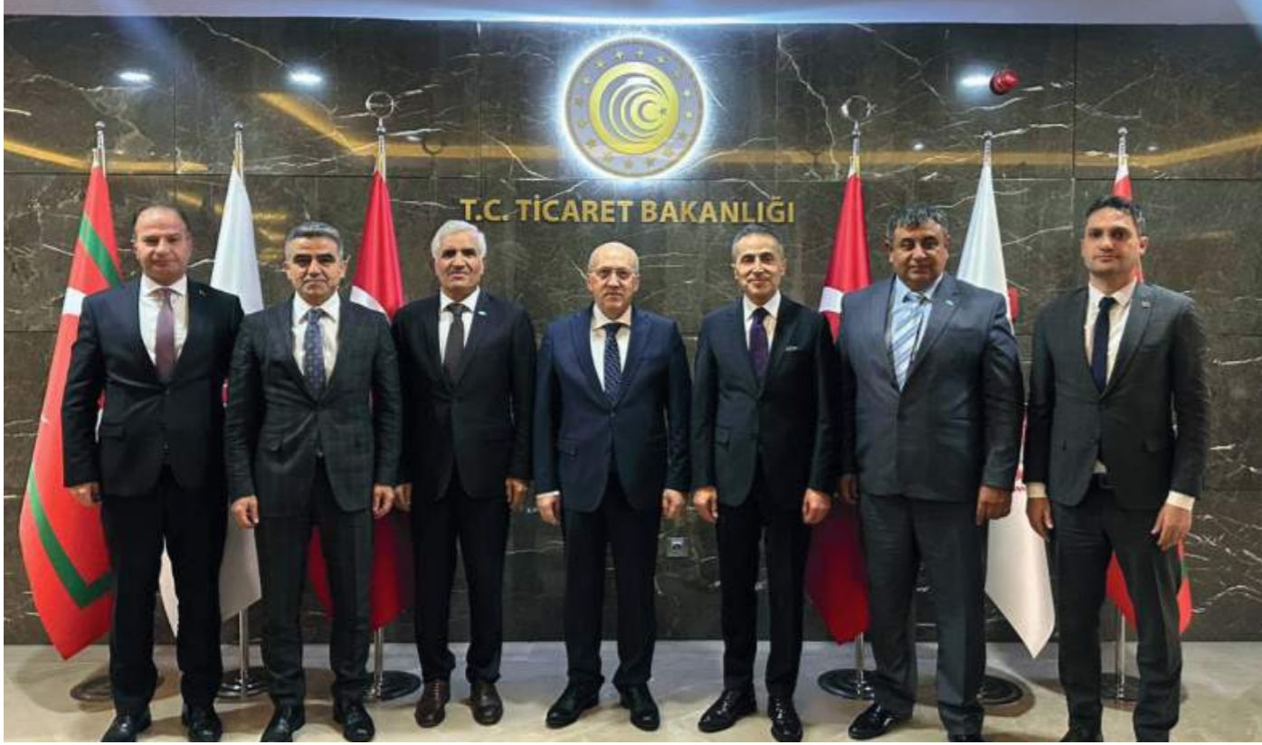
Ukrayna'dan Gelen Ahıskalı Türklerin Araç Tescil ve Gümrük İşlemlerine İlişkin Çalışmalar Regarding Vehicle Registration and Customs Procedures for Ahıska Turks Arriving from Ukraine