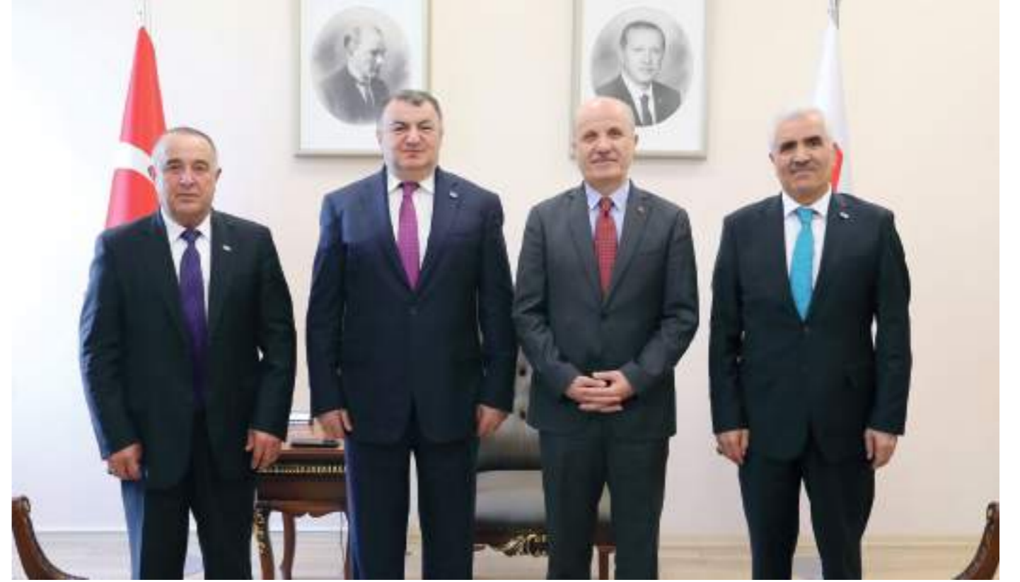
Ahıskalı Türklerin Diploma Denklik Süreçlerine İlişkin Çalışmalar Concerning Diploma Equivalency Processes for Ahıska Turks

During the meeting, solutions were evaluated to ensure that the vehicles brought by Ahıska Turks—who were forced to leave their country under wartime conditions—could be registered in compliance with Turkish regulations and that bureaucratic procedures could be facilitated. Officials reviewed technical details and potential regulatory arrangements and stated that the relevant units would initiate the necessary work. The DATÜB delegation affirmed that they would continue to work in coordination with all state institutions to address the needs of families during the resettlement process and to resolve any bureaucratic challenges encountered.